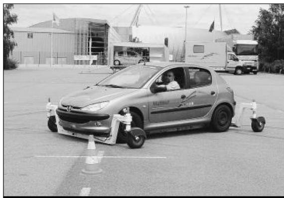
Un matériel spécial permet de tester différents types de conduite

Les caravanes de la compagnie d'assurance qui finance ce projet s'installent aujourd'hui, demain et vendredi à Rouen, ville étape dans un parcours qui fait le tour de France. Les conducteurs rouennais assurés à la Matmut, ou affiliés à d'autres compagnies retrouveront les bancs de l'auto-école durant ces trois jours. Trois formules sont à découvrir. Le stage de conduite préventive se compose d'une séance de simulateur de conduite qui analyse le comportement au volant en conditions de circulation réelle. « La simulation est basée sur de la conduite en milieu urbain mais aussi rural », explique la responsable. D'autres pour-